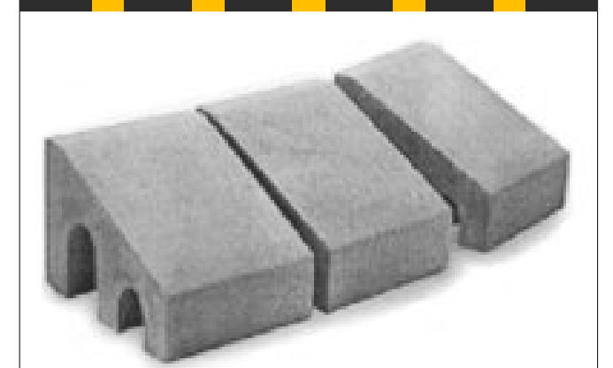
PARTICOLARE CORDOLO CONTENIMENTO LATERALE h=25 cm.