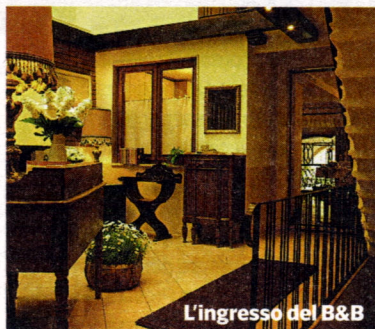
L'ingresso del B&B

Bed and Breakfast Casa Margherita - Via Broletto 44 - lacasadamargherita.it - Camera matrimoniale da 80 a 100 euro, con colazione In pieno centro a Mantova esiste un'antica residenza di soli tre alloggi composti da camere matrimoniali eleganti e spaziose, tutte con bagno privato. La colazione, servita in una sala che si affaccia sui portici, è ricca e a base di pane fresco e brioches da forno. Unica la cortesia della proprietaria Barbara.