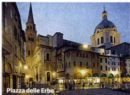
Piazza delle Erbe