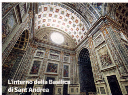
L'interno della Basilica di Sant'Andrea