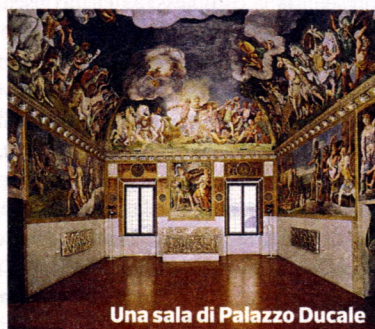
Una sala di Palazzo Ducale

Palazzo e Museo Ducale - Piazza Sordello 40 mantovaducale.beniculturali.it Sul lato sinistro di piazza Sordello domina la Reggia gonzaghesca di Palazzo Ducale con il suo Museo. Una città nella città con statue, arazzi, dipinti e tre aree riaperte al pubblico dopo il recente terremoto: l'intera Corte Vecchia, l'appartamento neoclassico detto dell'Imperatrice e l'appartamento della Guastalla, ultima duchessa di Mantova.