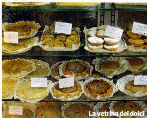
La vetrina dei dolci

Pavesi Panificio Pasticceria - Via Broletto 19 Tel. 0376 322460 - panificiopavesi.com Aprite le danze del mattino attraversando il ponte di San Giorgio e godetevi una vista della città ancora più suggestiva se vi fate ritorno al crepuscolo. Dopo il vicino castello tardo-medievale si apre piazza Sordello, cuore dei Gonzaga. Un passo oltre il Duomo e il voltone, siete da Pavesi, paradiso dei dolci artigianali: delicato il tortino di riso e squisita la "torta al Voltun".