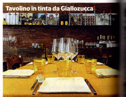
Tavolino in tinta da Giallozucca