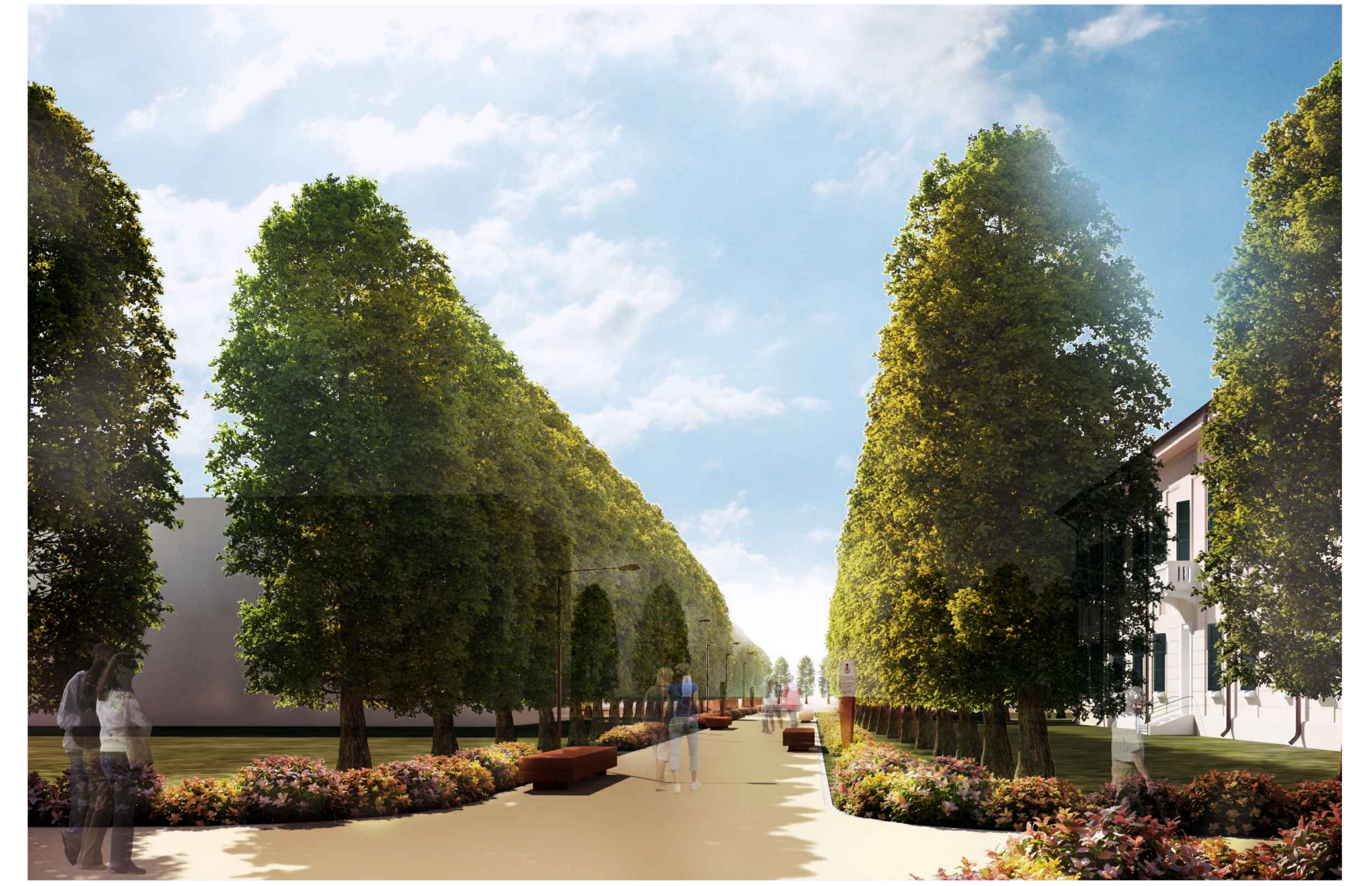
3) VISTA DALLA PIAZZA FRONTE SUD