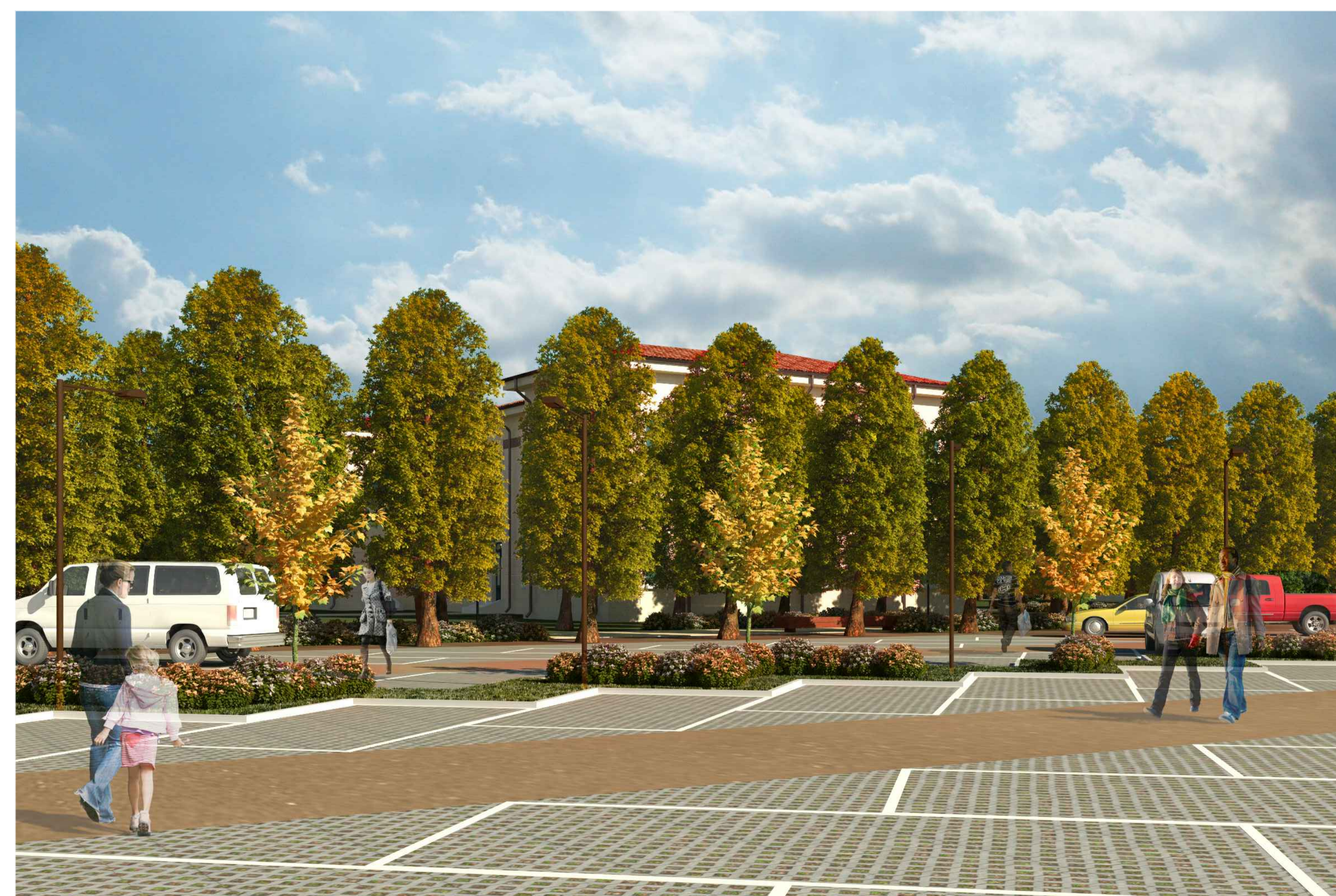
8) VISTA FRONTE OVEST