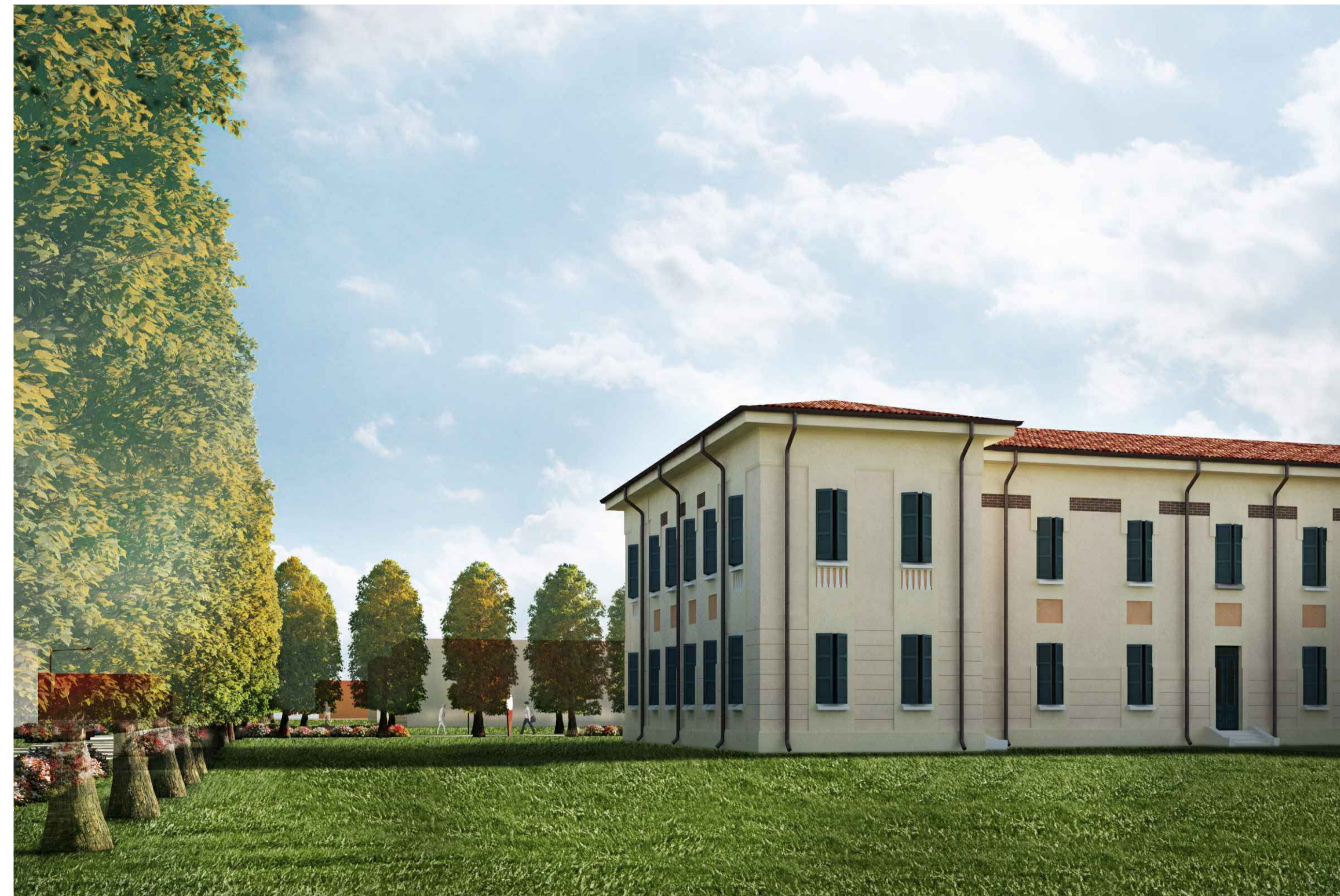
5) VISTA GIARDINO INTERNO SUD-OVEST