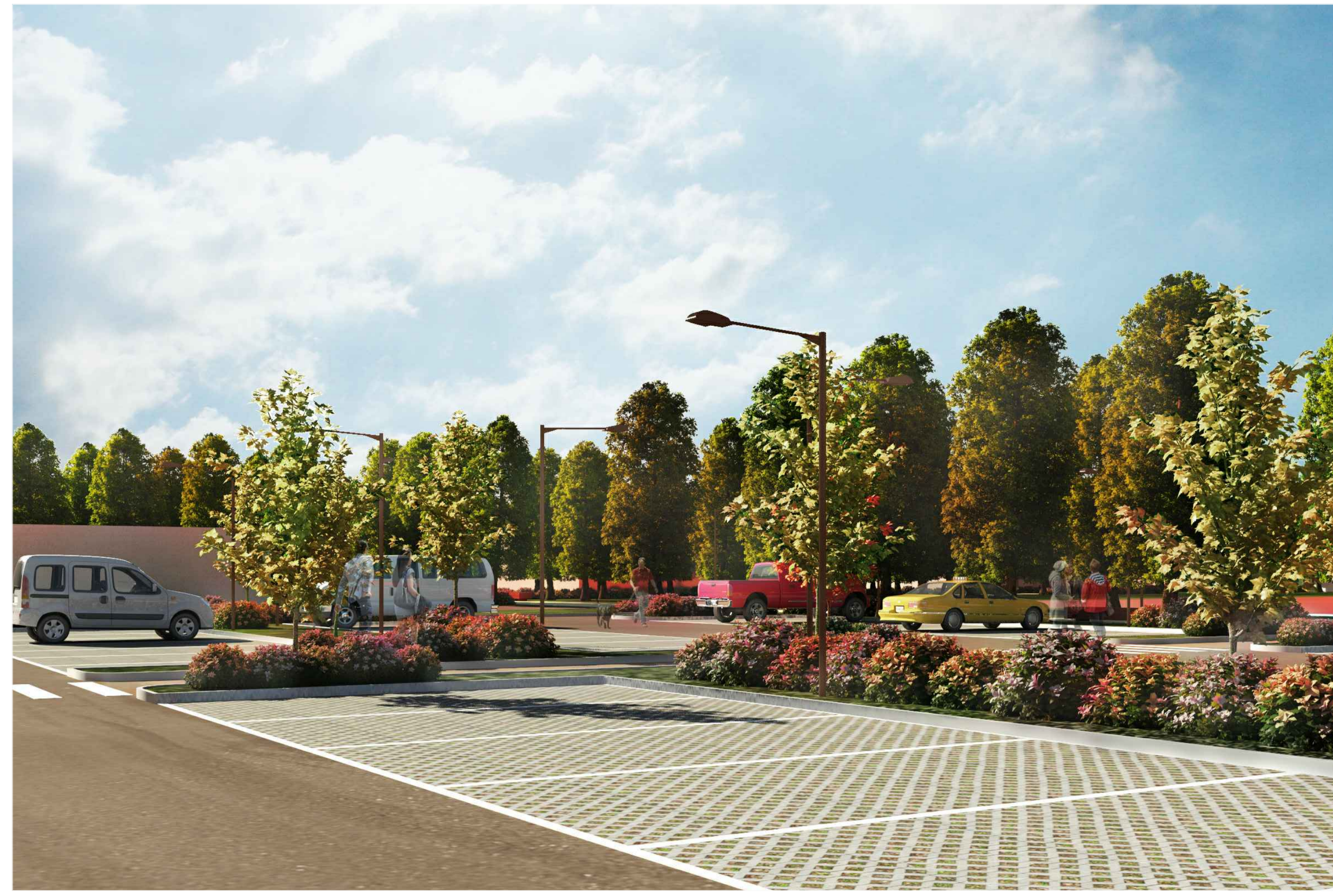
1) VISTA INGRESSO SUD