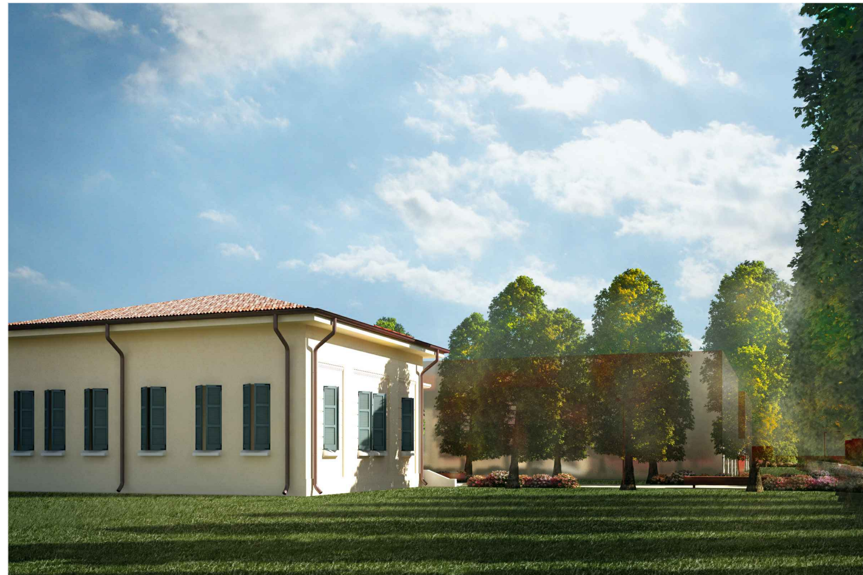
4) VISTA ACCESSO GIARDINO INTERNO