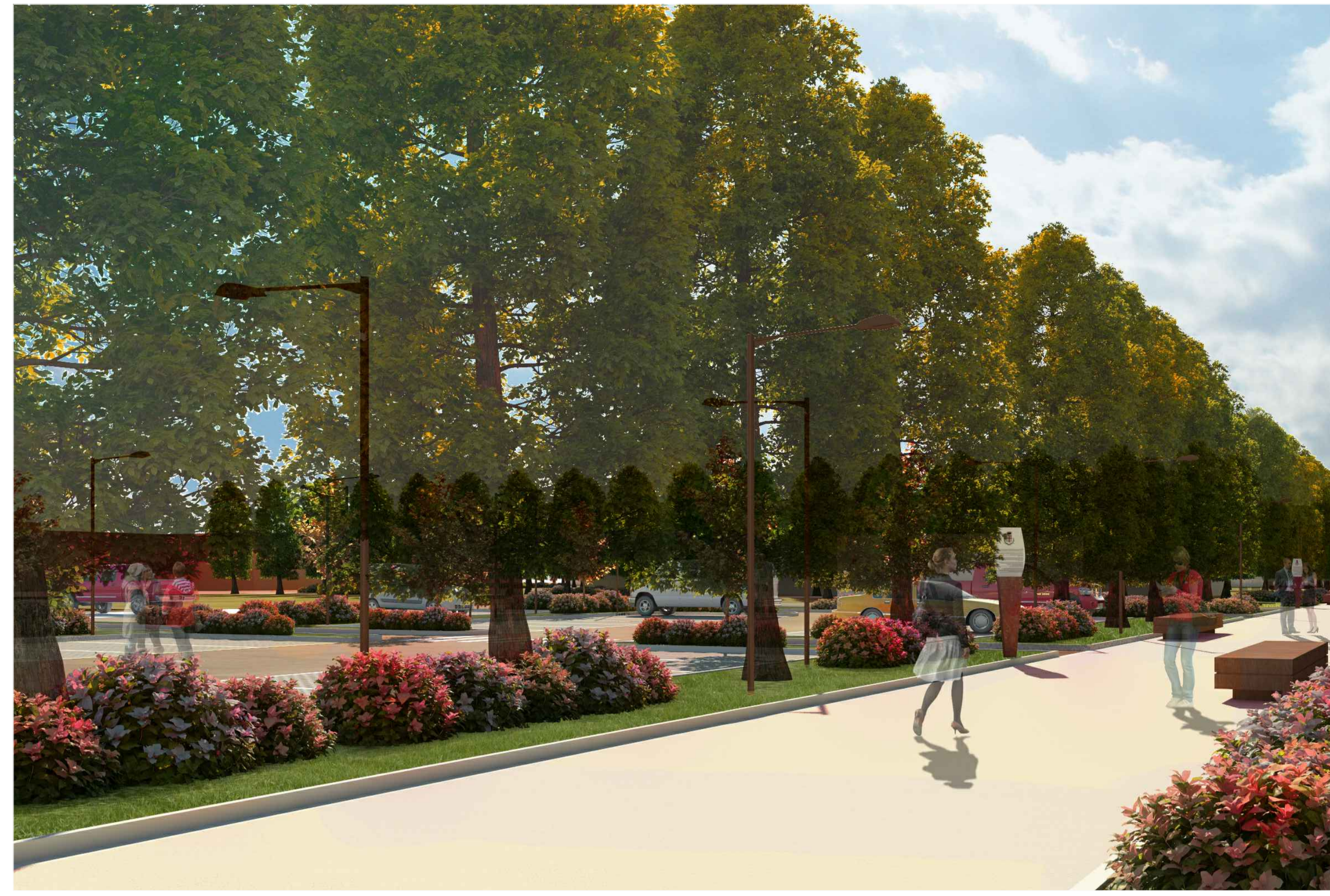
2) VISTA INGRESSO SUD-EST