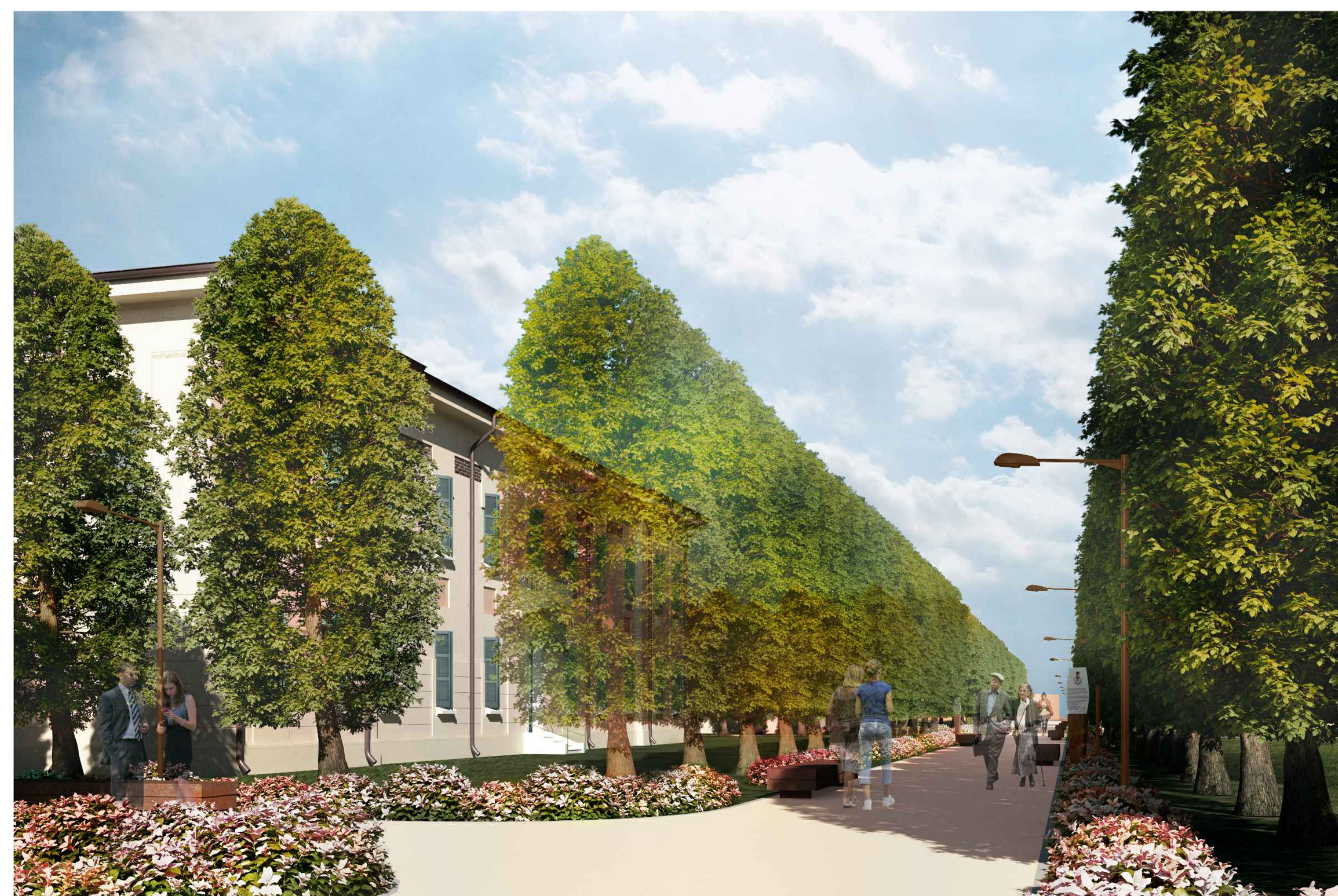
7) VISTA GIARDINO INTERNO SUD-EST