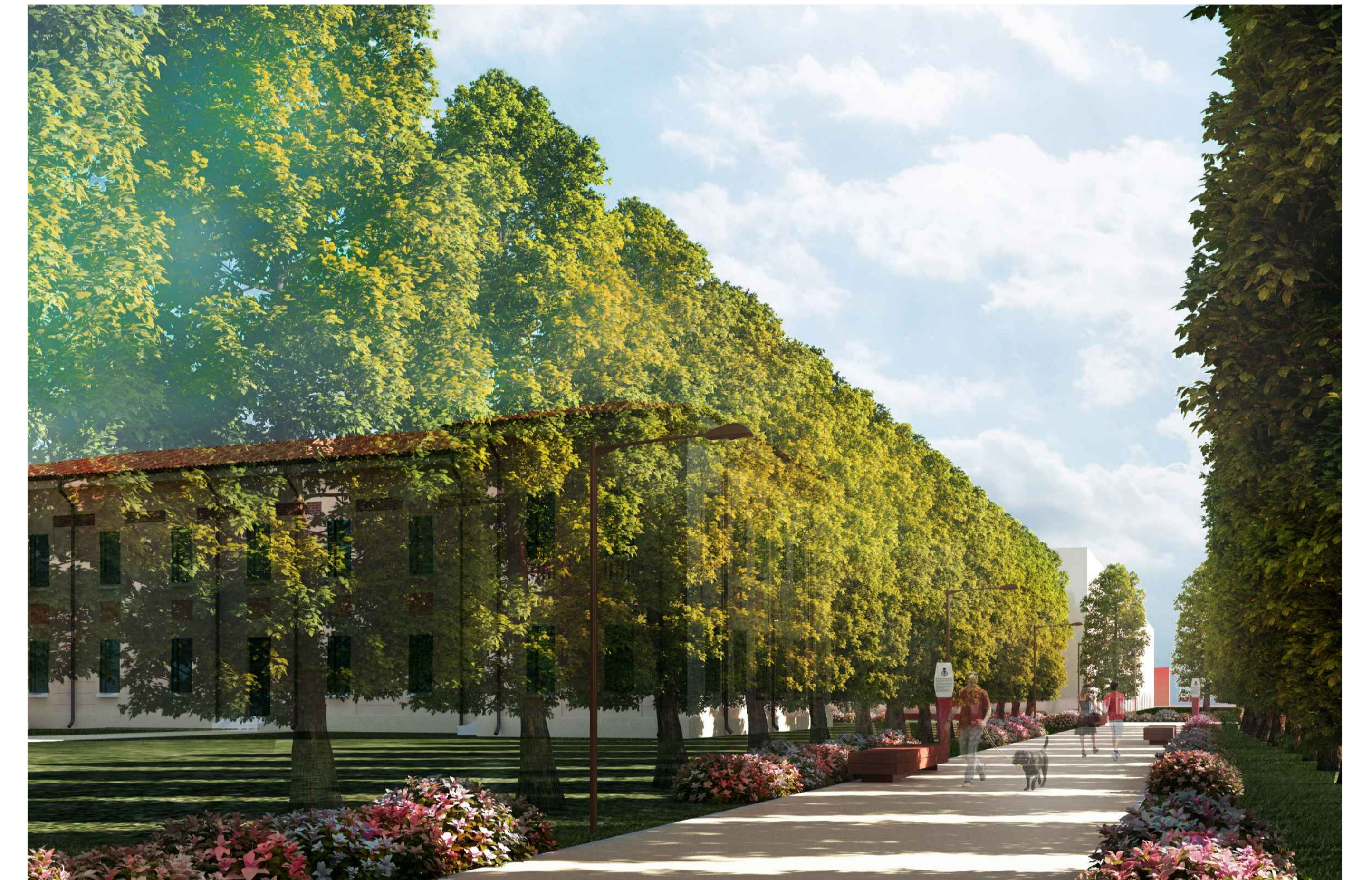
6) VISTA GIARDINO INTERNO FRONTE SUD